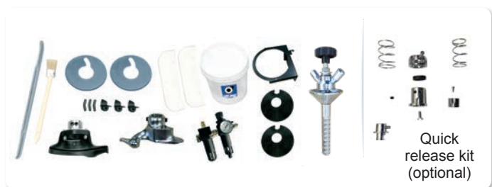
Quick release kit (optional)

THE REAL "WORK-HORSE" FOR YOUR TYRE SHOP!!