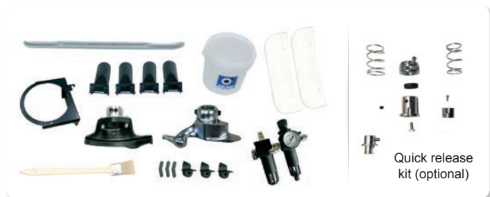
Quick release kit (optional)

THE REAL "WORK-HORSE" FOR YOUR TYRE SHOP!!