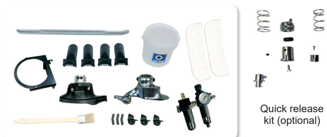
Quick release kit (optional)

Tyre changer for Intensive use THE "HARD DUTY" LINE : Everything you need for a busy shop dealing with all kinds of CAR, LCV and LIGHT TRUCK tires and wheels (motorcycle tyre fitting options available) !!